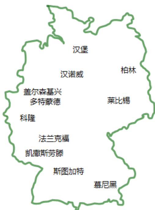
2006 德国世界杯比赛用球场分布图